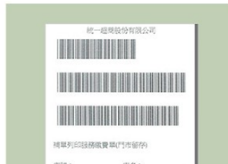
6. 攜帶繳費單至櫃檯繳費