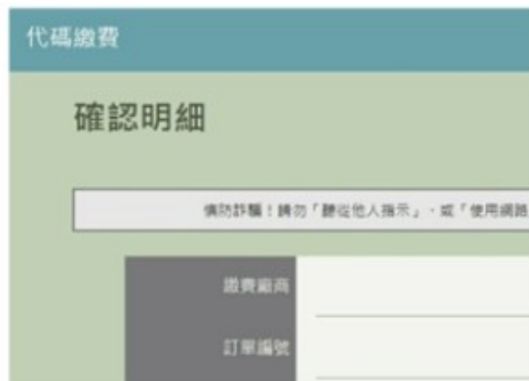
4. 確認金額、項目是否正確